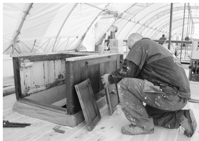
Träddäcket är nu lagt och ska hålla i 40 år framåt om man underhåller det.